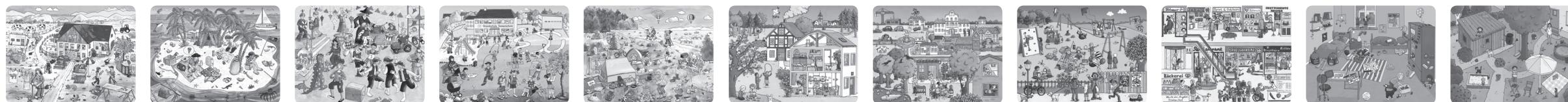
Illustration: Vera Brüggemann

D: Nicht für Kinder unter 3 Jahren geeignet: Verschluckbare Kleinteile