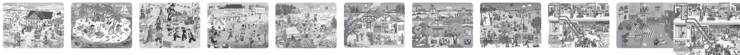
Illustration: Vera Brüggemann

D: Nicht für Kinder unter 3 Jahren geeignet: Verschluckbare Kleinteile