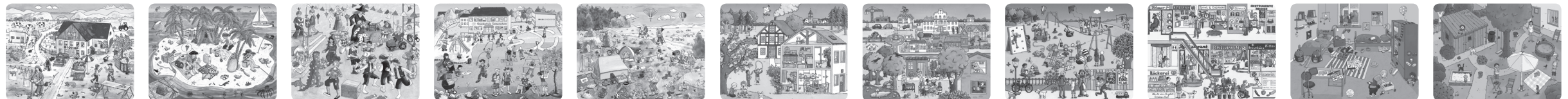
Illustration: Vera Brüggemann

D: Nicht für Kinder unter 3 Jahren geeignet: Verschluckbare Kleinteile