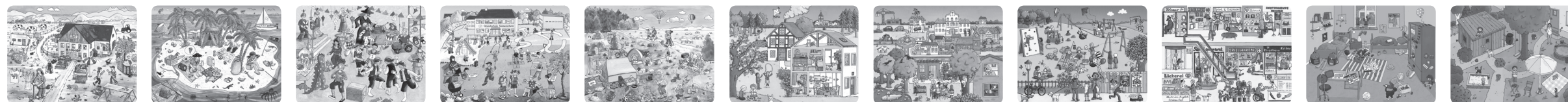
Illustration: Vera Brüggemann

D: Nicht für Kinder unter 3 Jahren geeignet: Verschluckbare Kleinteile